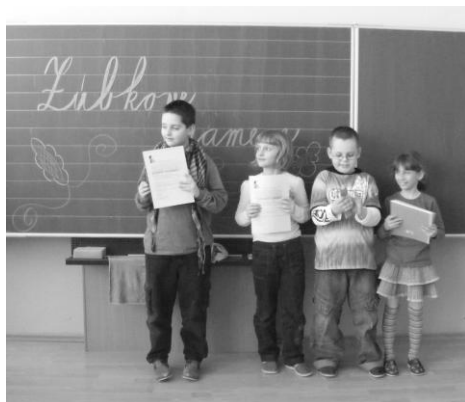
Školské kolo - víťazi v I. kategórii v prednese prózy