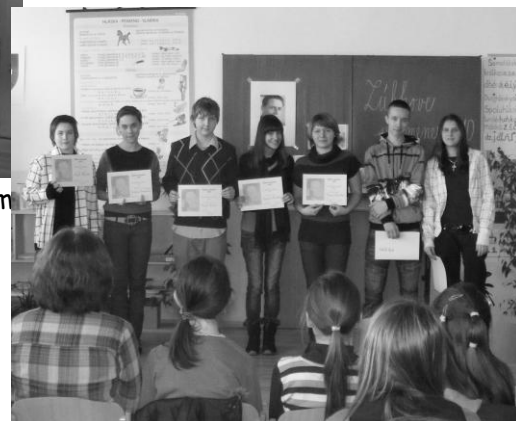
Naše úspešné ôsmačky v obvodnom kole