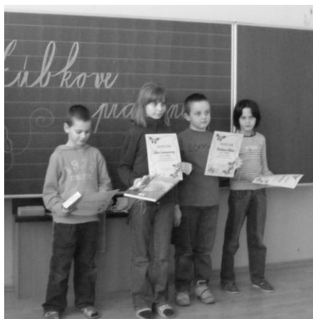
Školské kolo - ocenení v I. kategórii v prednese poézie