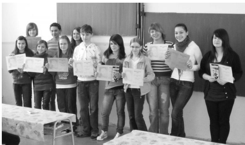
Spoločné foto úspešných recitátorov II. a III. kategórie v školskom kole