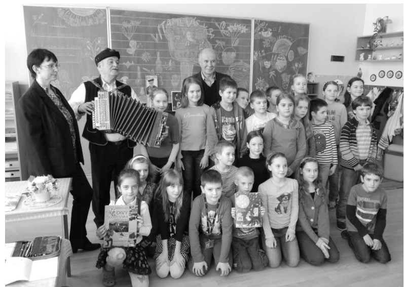
a záverečné foto...