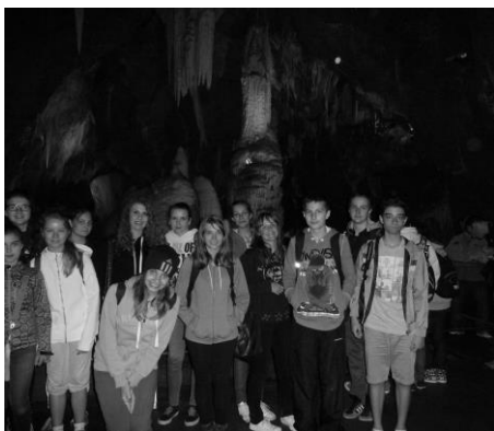
V podzemí bolo chladno, vlhko, tmavo ...krásne!