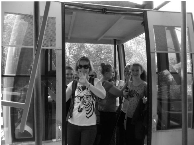
Do videnia, priatelia, dolu!