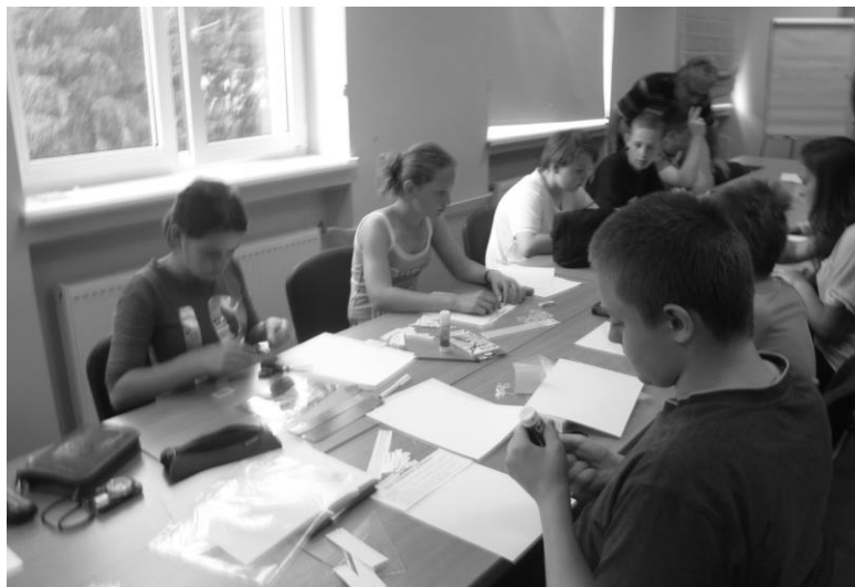
A v sobotu sme vytvárali minieponát...