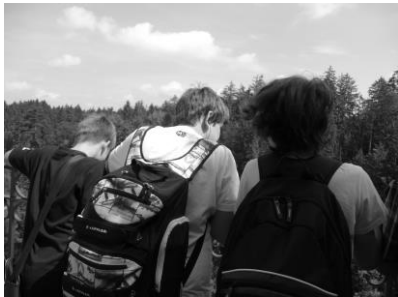
Je to hlboké? Je.

Domov sme sa vracali unavení, ale plní zážitkov a krásnych dojmov.