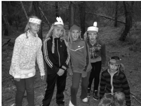
Tušíte správne - indiánsky chodník

Super výletom bola aj návšteva Demänovskej jaskyne slobody, najviac navštevovanou sprístupnenou jaskyňou Slovenska. Národná prírodná pamiatka Demänovské jaskyne na severnej strane Nízkyh Tatier je i najdlhším jaskynným systémom na Slovensku. Demänovská jaskyňa slobody dlhé roky očaruje návštevníkov bohatou sintrovou výplňou rozličných farieb, tajuplným podzemným tokom Demänovky i čarokrásnymi jazierkami. Objavili ju už v roku 1921. Dĺžka sprístupneného úseku je 1800 m. Prevýšenie medzi vchodom a Prízemím je 66 m, medzi Prízemím a východom z jaskyne 85 m. Obdivovali sme Zlaté jazierko, Barokové bábiky, riečisko Demänovky so Stromom života. Tak a ešte mnohými inými poetickými menami sú nazývané stalagmity, stalaktity aj stalagnáty.