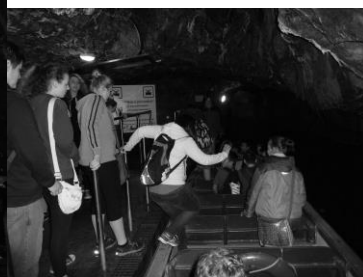
Veľmi sa nám páčila plavba na lod'kách podzemím