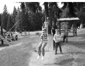
Každý si našiel to svoje: preliezky, kolotoče, minigolf, stolný tenis, futbal, volejbal...