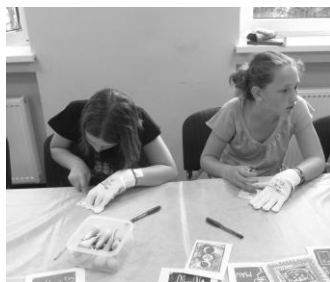
Takto sme tvorili návrhy známok - kreslili, ryli, odtlačili