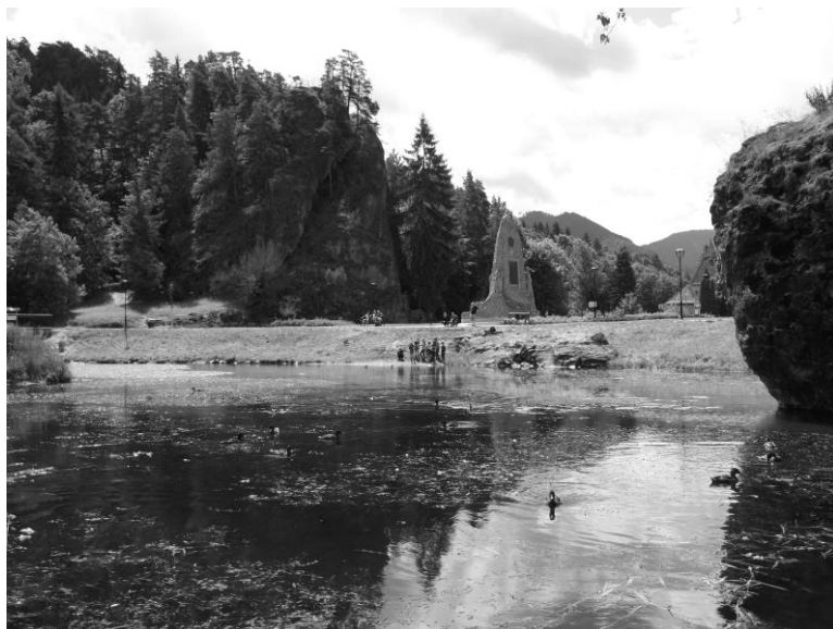
Pri jazierku - zvyšku vodnej priekopy pri Hrádku