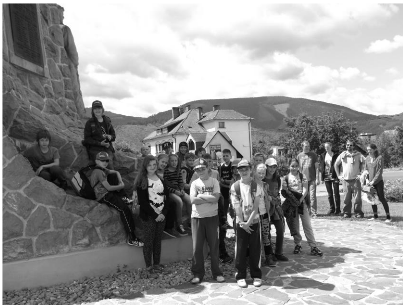
Pri Hrádku v Liptovskom Hrádku