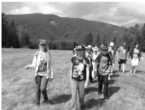
Liptov je skutočne prekrásny!