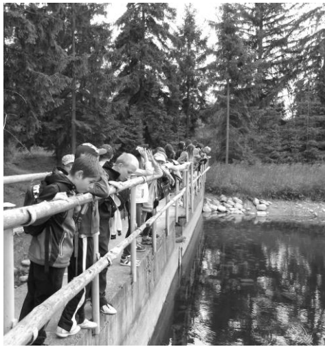
V Pribyline je krásne - skanzen uprostred lesov. Posilnili sme sa, pokrútili kolesom na studni, ktoré sa točiť ani nemalo...