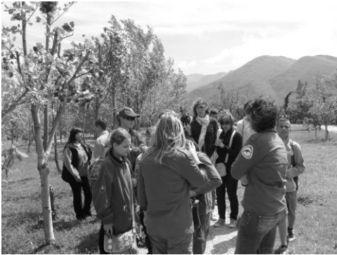
V botanickej záhrade