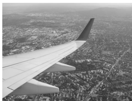
Pod nohami Viedeň