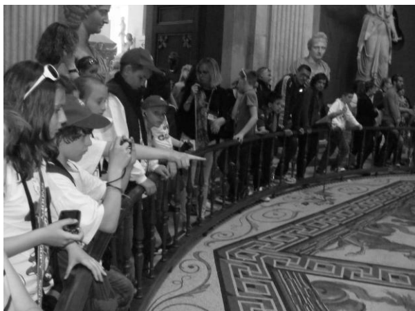
Pri najväčšej mozaike v Ríme

Vrcholom rímskeho popoludnia sa stala návšteva najmenšieho štátu na svete (0,44 km 2 ). Vatikán (Il Vaticano, Città del Vaticano) je cirkevný štát na čele s pápežom - Svätým otcom - dnes Benediktom XVI. Sídлом pápežov je len od r. 1378. Jeho predchodcom bol Cirkevný štát, ktorý sa začal konštituovať už v 4. storočí. Pred presťahovaním pápežského dvora do Avignonu (1309 - 1377) bol pápežským sídlom Laterán. Na stolci sv. Petra dodnes sedelo 265 pápežov, medzi nimi mnoho mučeníkov a svätcov. Najskôr účastníci projektu, podobne ako stovky iných ľudí, prešli kontrolou. Počkali na vstupenky a so sprievodkyňou sa vybrali do múzeí.