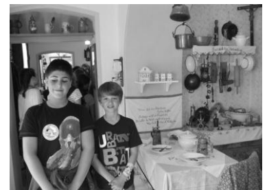
Chlapci v muzeálnej kuchyni

V prírodnom divadle - tá bodka na oblohe nie je mucha na fotoaparáte, ale bocian