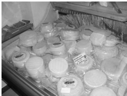
Okrúhle syry čakajúce na to, aby mohli potešiť ne jeden maškrtný jazýček