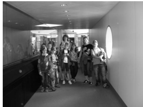
Pred nastúpením do lietadla