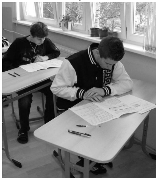
...a už pracujeme.