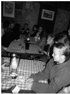
Čože nám prinesú?