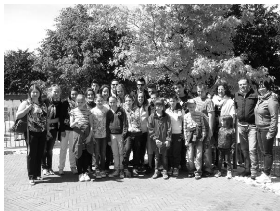
Pred odchodom z Piglia s talianskymi rodinami

ARRIVEDERCI, Taliansko! Azda sa ešte niekto z detí či učiteliek vráti na spomenuté miesta a pripomenú si aj spoločných šesť veľmi pekných medzinárodných dní.