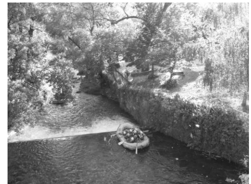
Pred perejami na rieke Aniene...

V stredu 16. mája ráno sa účastníci stretnutia vyrazili za pravdou. Hovorí sa, že pravda je ukrytá vo víne, tak sa o tom išli presvedčiť. A možno ju našli aj v mlieku. Prečo? Piglio leží v nádhernom kraji viníc, olivových sádov, pasienkov.