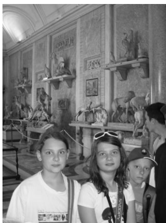
Vo vatikánskej ZOO

Vrcholom rímskeho popoludnia sa stala návšteva najmenšieho štátu na svete (0,44 km 2 ). Vatikán (Il Vaticano, Città del Vaticano) je cirkevný štát na čele s pápežom - Svätým otcom - dnes Benediktom XVI. Sídлом pápežov je len od r. 1378. Jeho predchodcom bol Cirkevný štát, ktorý sa začal konštituovať už v 4. storočí. Pred presťahovaním pápežského dvora do Avignonu (1309 - 1377) bol pápežským sídlom Laterán. Na stolci sv. Petra dodnes sedelo 265 pápežov, medzi nimi mnoho mučeníkov a svätcov. Najskôr účastníci projektu, podobne ako stovky iných ľudí, prešli kontrolou. Počkali na vstupenky a so sprievodkyňou sa vybrali do múzeí.