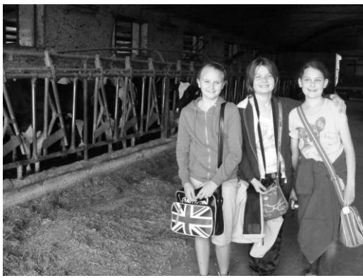
Začiatok mliečnej cesty - v maštali