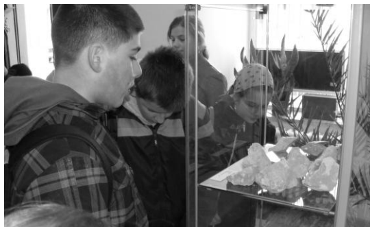
Pohľady až na morské dno