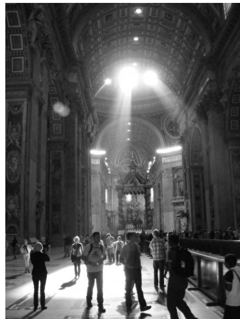
Lúče zapadajúceho slnka v chráme

Z chrámu vyšli naši cestovatelia na Námestie sv. Petra (Piazza San Pietro). Toto veľkolepé námestie bolo založené pred dostavanou Bazilikou sv. Petra v r. 1656 - 1667. Obklopujú ho štyri polkruhové kolonády celkom s 284 stĺpmi a 88 piliermi z travertínu. Uprostred stojí 25,5 m vysoký egyptský obelisk vztýčený na tomto mieste v r. 1586.