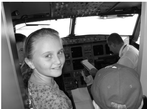
Zaujímavý pohľad do kokpitu