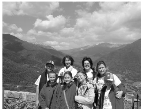
Super výhľad z hradnej veže s vetrom vo vlasoch