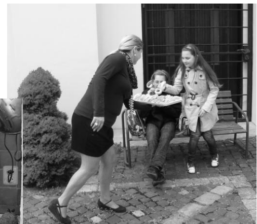
Ochutnávka trdelníka na záver