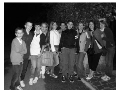
Rozlúčka pred reštauráciou

Aj večer strávili účastníci projektu spoločne. Hostiteľské rodiny ich pozvali na pizzu či zemiakové hranolčeky do reštaurácie. V príjemnom prostredí sa deti zahrali, dospeláci sa porozprávali. Skvelé završenie stredajšieho programu.