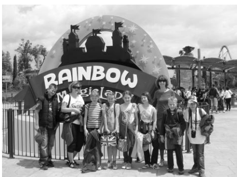
Vítajte v zábavnom parku!