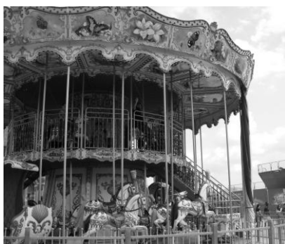
Decká ani učky neodolali - sadli si na kolotoč