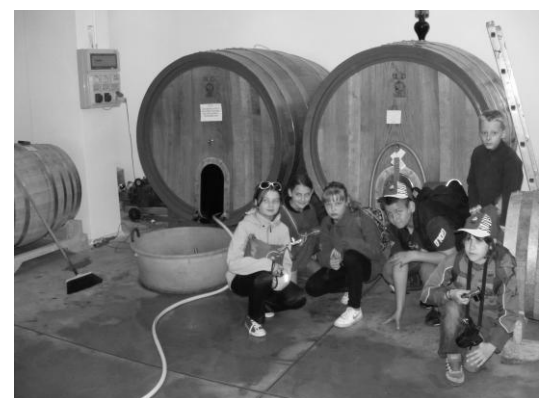
Také malé súdočky