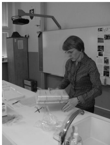
...rozbaľovanie a kontrola testov