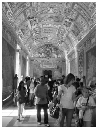
V nádherných priestoroch

Paláce a umelecké zbierky vytvárajú muzeálny komplex mimoriadneho významu, ktoré vznikali už od čias Júliusa II. (1506). Patrí sem napr. veľká obrazáreň Pinacoteca založená Piusom VI. (1775 - 1799), Pio Clementino so zbierkou sôch, Raffaelove sály s unikátnymi freskami a Sixtínska kaplnka postavená za pápeža Sixta IV. už v r. 1475 - 1483, ktorá je vzácnou obrazárňou talianskeho renesančného maliarstva 15. a 16. stor. (najmä Michelangelov strop z r. 1508 - 1512 a jeho „Posledný súd“ z r. 1535 - 1541). Len škoda, množstvo ľudí v Sixtínskej kaplnke skôr pripomínalo dolnú časť Václavského námestia v Prahe.