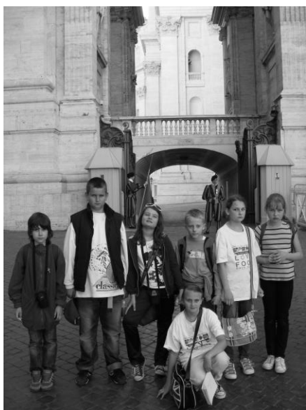
Už na Námestí sv. Petra