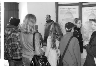
Pred a v Rotunde sv. Juraja