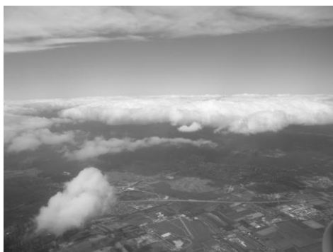
Taliansko z výšky