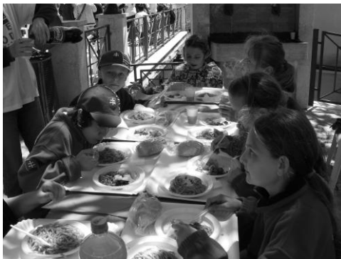
Spoločný obed na námestí

V utorok 15. mája sa naši cestovatelia premiestnili do Trevi nel Lazio, kde sa nachádza ďalšia časť školy. Žltý školský autobusík sa šplhal po pomerne úzkych cestách, ktoré chvíľami tvorili serpentíny. Ostré zákruty veru niektorým nerobili dobre. Pohľad spred školy v Trevi nel Lazio však bol úchvatný! Kopce, hory, lesy, sýta zelená farba. Hostia sa najskôr oboznámili so školou. Nasledovala prehliadka botanickej záhrady, ktorá predstavuje chránenú prírodnú oblasť Monti Simbruini. Po návrate na kamenné námestie ako vystrihnuté zo starých talianskych filmov sa deti zaoberali výrobou tradičných cestovín z rezancového i zemiakového cesta „Fettuccine e Gnocchi“. Miesili, valkali, rezali, tvarovali pomocou vidličky. Tvorivá dielňa sa o chvíľu premenila na jedáleň pod holým nebom. Všetci spoločne obedovali na námestí tradičné cestoviny, zemiaky s mäsom a zeleninou. Popoludní aj naša desiatka vystúpila na hrad v Trevi nel Lazio. Aj na jeho najvyššiu vežu. Mestečko i široké okolie všetci pozorovali priam z vtáčej perspektívy.