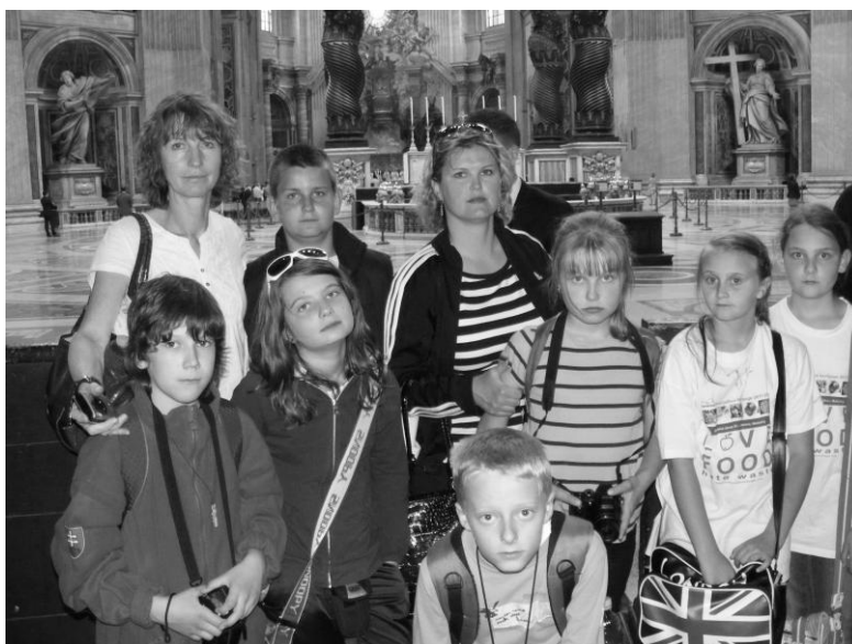
V Bazilike sv. Petra

Únavný, no zároveň úžasný deň. Nasledoval návrat do Piglia. Všetkých čakal posledný večer pred odchodom domov. A veru sa aj tešili. Bolo treba pobaliť batožinu, zamknúť kufre a čakať na ráno. Ranné prekvapenie? Malé námestie pri škole v Pigliu, kam sa slovenskí účastníci projektu išli rozlúčiť i podakovať, sa veľmi zmenilo. Tichá ulica ožila farebnými stánkami. Začal sa trh. Čerstvé ovocie, zelenina, syry, olivy, ryby a iné morské príšerky, ba aj oblečenie. Ešte kúpiť posledné drobnosti blízokým a prichádza chvíľa rozlúčky. Kde sa však zabudol autobus? Meškajúci šofér ukladá batožinu do útrobov autobusu. Posledné zamávanie... V nejednom oku sa zjaví slzička. Našu desiatku účastníkov zjazdu čaká presun na letisko. Všetko je perfektne načasované. Z autobusu ihneď vyhladať leteckú spoločnosť, kontrola dokladov, odovzdanie batožiny, osobná prehliadka, autobus, lietadlo... Viedeň. O hodinku sa všetci stretli so svojimi blízkymi.