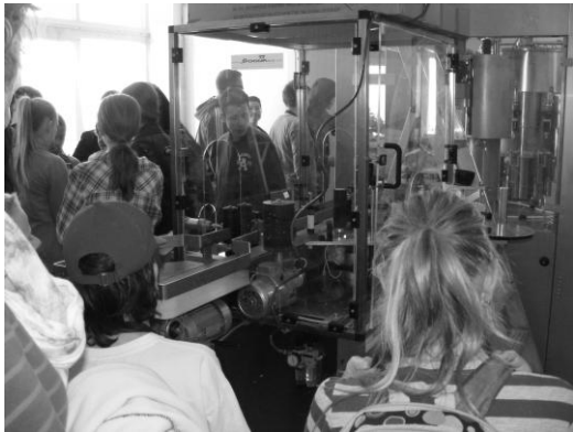
Pri plničke mlieka