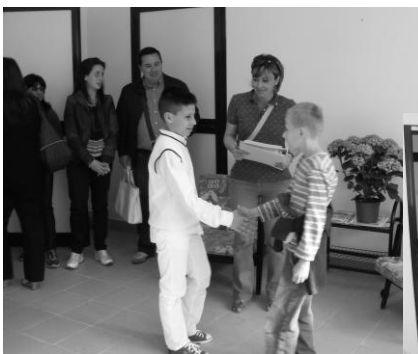
Stretnutie s talianskymi priateľmi