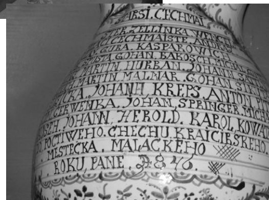
Tu sme objavili i džbán malackého cechu krajčírského z roku 1846