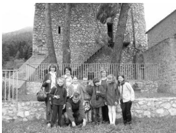
Na hrade nad mestom