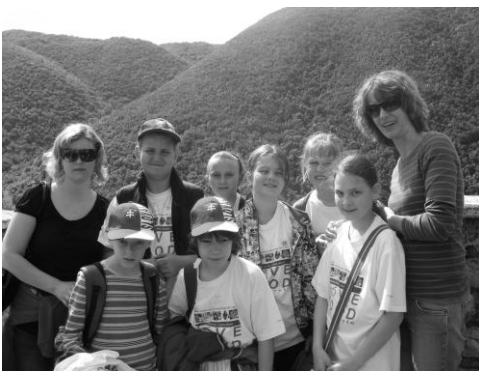
Verili by ste, že deti a pani učiteľky stoja pred školou?