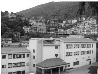
Škola v Pigliu

V popoludňajších hodinách partnerské školy prezentovali svoju prácu na projekte v uplynulom období. Nasledoval kultúrny program na nádvorí školy. Mladší aj starší žiaci spievali, tancovali, predviedli i typické prvky folklóru v oblasti mestečka Piglio.