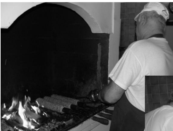
V „čiernej kuchyni“ je skutočne veľmi horúco